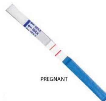
Pregnancy test strip