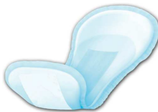
Pad without wings