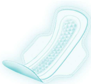
Pad with wings