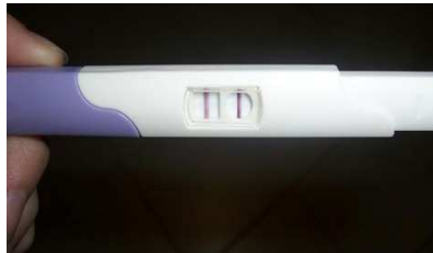
Digital Pregnancy Test